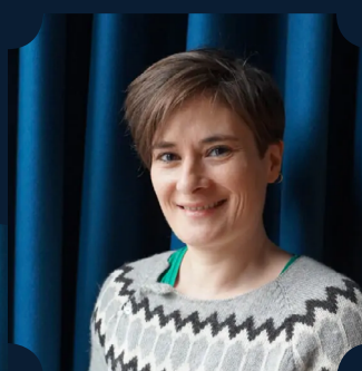
EDMUND AF KENT, KONGENS BROR Xenia Noetzelmann