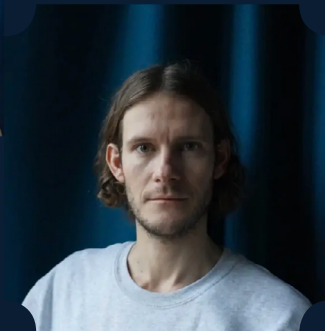
PIERS GAVESTON Simon Bennebjerg