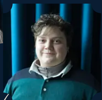
PRINS EDWARD m.fl. Ena Spottag